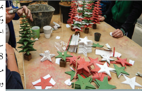
زينة عيد الميلاد يصنعها السجناء

بمناسبة عيد ميلاد السيد المسيح وكتمرين تجربي لورشه المنتجات الخشبية قبل إطلاقها رسمياً في سجن رومية في أوائل عام 2018، شرع المكتب بنشاط مدرّ للدخل للسجناء. ففي ورشتين مختلفتين (إحداها للبالغين وأخرى للأطفال)، شارك نحو 20