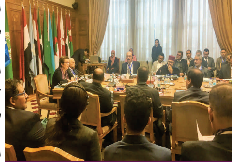
افتتح الاجتماع الممثل الإقليمي (يساراً) والأمين العام المساعد لقطاع الشؤون القانونية (يميناً)

التقى المكتب وجامعة الدول العربية و18 بلداً عربياً في تشرين الثاني/نوفمبر في الاجتماع السنوي للجنة التسيير والمتابعة. حيث اجتمع 65 ممثلاً عن وزارات الداخلية والصحة والعدل والشؤون الخارجية، مشكّلين بذلك لجنة تسيير ومتابعة البرنامج الإقليمي للدول العربية لمنع ومكافحة الجريمة والإرهاب والتهديدات الصحية، وتعزيز نظم العدالة الجنائية بما يتماشى مع المعايير الدولية لحقوق الإنسان (2016-2021) لمراجعة التقدم المحرز في عام 2017 في تنفيذ البرنامج. وفي ختام الاجتماع اتفق الحضور على الأولويات التي ستنفذ عام 2018. وتتوج الاجتماع بمجموعة من التوصيات.