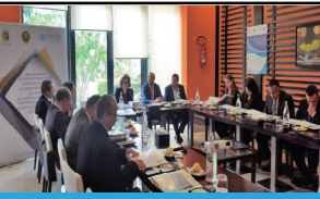
تدريب موظفي السجن

نظم المكتب دورتين تدريبيتين مدة كل منهما خمسة أيام على تقديم المجموعة الشاملة من تدابير التدخل الصحية في الأماكن المغلقة في كانون الأول/ديسمبر، ركزت على تقديم الخدمات الرئيسية للوقاية من فيروس نقص المناعة البشرية والتهاب الكبد والأمراض المنقولة جنسياً والسل وعلاج ورعاية المصابين بها، وخدمات خفض الضرر المتعلقة بالمخدرات في السجن، بالامتثال لمبادئ القانون الدولي والمعايير المنظمة للصحة في السجن. وقد شارك فيها نحو 45 موظفاً طبيياً شبه طبيياً في السجن من وزارة الصحة والمنظمات الوطنية غير الحكومية. تمول مؤسسة دروسوس هذا المشروع