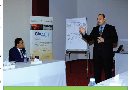
عضو النيابة المصري يناقش التحديات

عُقدت في كانون الأول/ديسمبر ورشة عمل على مكافحة تهريب المهاجرين لأعضاء النيابة المصرية في الغردقة والفيوم، بهدف تدريب أعضاء النيابة المصرية على مهارات تحقيق محدّدة، شاملةً محاكمة صورية تفاعلية. وقد سلط النقاش حول التحديات التي يواجهها أعضاء النيابة عند التحقيق في قضايا تهريب المهاجرين وملاحقة مرتكبيها قضائياً الضوء على التعقيد الذي تنسم به الهجرة وتهريب المهاجرين وطابعهما متعدد الأبعاد. تمول الاتحاد الأوروبي هذا المشروع