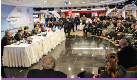
حفل افتتاح وحدة مراقبة الموانئ

في الفترة بين تشرين الأول/أكتوبر وكانون الأول/ديسمبر، نظم برنامج مراقبة الحاويات تدريباً على السلائف الكيميائية والمخدرات لميناء صُحار في عمان؛ وتدريباً عملياً لميناء طنجة المتوسط وميناء الدار البيضاء في المغرب؛ وقدم التوجيه