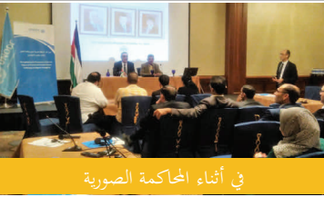
في أثناء المحاكمة الصورية

أجريت في البحر الميت في أيلول/سبتمبر وتشرين الأول/أكتوبر أول محاكمة صورية حول الاتجار بالأشخاص في المنطقة، استمرت لأربعة أيام وحاكت قضية تجار بالبشر، تناولت قصة امرأة إثيوبية ذات 25 ربيعاً سافرت إلى عمان معتقدة أنها قبلت عرضاً للعمل في أحد الفنادق. وعند وصولها، أخبرها "رب العمل" أنها ستعمل عاملة في منزل خاص، فقررت اللجوء إلى الشرطة. ثم طُلب من ممارسي العدالة الجنائية الأردنيين (أعضاء نيابة وقضاة وضباط شرطة وغيرهم) تحديد الجاني والتحقيق في القضية وإحالتها إلى المحكمة. تمول المشروع النمسا والنرويج