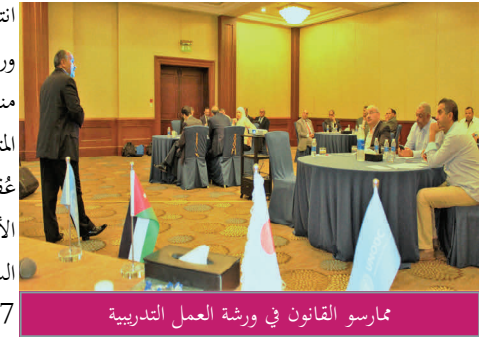
ممارسو القانون في ورشة العمل التدريبية

انتهى المكتب من سلسلة من سبع ورش عمل تدريبية، مدّة كلّ واحدة منها يومان، على المساعدة القانونية المتبادلة لممارسي القانون في الأردن، عُقدت آخر هذه الورش في كانون الأول/ديسمبر. وقد استندت السلسلة التي بدأت في آذار/مارس 2017، إلى "الدليل التطبيقي