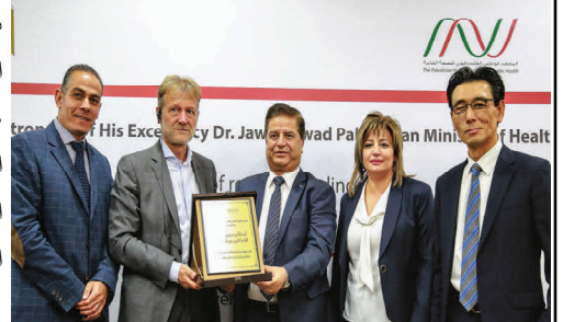
وزير الصحة الفلسطيني (في الوسط) والمكتب (الأول يساراً)

دعم المكتب وزارة الصحة الفلسطينية في إعداد دراسة شاملة عن تعاطي المخدرات غير المشروعة في فلسطين، تناولت اتجاهات تعاطي المخدرات غير المشروعة وانتشارها، بما في ذلك دراسة تقدير حجم التعاطي، ومعالجة إدمان المخدرات،