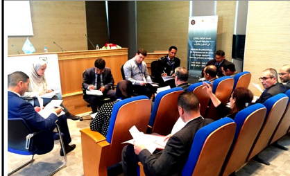
مناقشات مجموعات العمل

دراسة استقصائية عن مدى تعاطي المخدرات غير المشروعة في الضفة الغربية، بما فيها القدس الشرقية وغزة، أطلقها المعهد الوطني الفلسطيني للصحة العامة وقدمها إلى نائب وزير الصحة ومنظمة الصحة العالمية، ووكالة التعاون الدولي الكورية والمكتب. وكان المعهد الوطني الفلسطيني قد أجرى هذه الدراسة الاستقصائية والتي هي الأولى من نوعها منذ عام ٢٠٠٦،