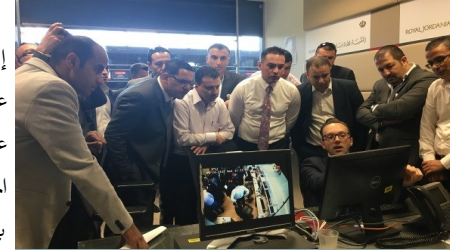
خبير الاستهداف يشرح للحضور تحليل البيانات

في فعالية عُقدت شهر أيار/مايو، دَرَبَ المكتب ٢٠ مسؤولاً مكلفاً بإنفاذ القانون من وزارة الداخلية للتعامل بشكل أفضل مع قضايا العنف ضد النساء والفتيات. وقد أبرزت هذه الورشة، وهي الأولى في سلسلة من خمس ورش عمل، أهمية دور الشرطة في مكافحة هذه الجريمة. وبنهاية سلسلة