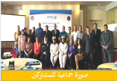
صورة جماعية للمشاركين

مشروع الاتصال بين المطارات يدرّب على الفرز والاستهداف