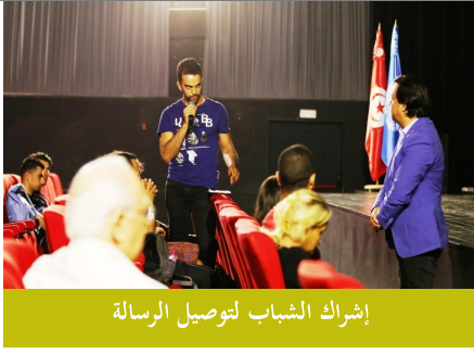
إشراك الشباب لتوصيل الرسالة

قام المكتب بالشراكة مع "الجمعية التونسية لمقاومة الأمراض المنقولة جنسيا والسيدا - تونس"، بتنظيم فعالية في حزيران/يونيه للاحتفال باليوم الدولي لمكافحة إساءة استعمال المخدرات والاتجار غير المشروع بها، شارك فيها نحو ١٠٠