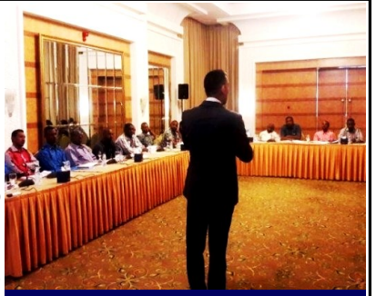
خبير الاتجار يعرف المهجيات

بغرض تحسين التصدي لجريمة الاتجار بالبشر، نظم المكتب تدريبين في السودان، عُقد أولهما في نيسان/أبريل لـ ٣٠ من مسؤولي إنفاذ القانون من الوحدات المعنية في وزارة الداخلية، وركز على منهجيات وتقنيات إجراء المقابلات مع مرتكبي الجرائم وضحاياها والشهود عليها، ومراحل التحقيق والتعاون الإقليمي والدولي. كما ناقشت خلاله مواضيع حماية