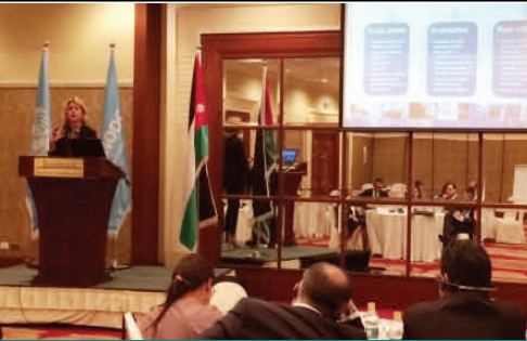
خبيرة الاتجار تخاطب المشاركين

بغية التصديّ للاتجار بالأطفال، عقد المكتب تدريبا في الأردن للأردنيين المكلفين بإنفاذ القانون على مكافحة تلك الجريمة، وذلك بالتعاون الوثيق مع وحدة مكافحة الاتجار الأردنية. وقد عرّف التدريب الذي عُقد في تموز/