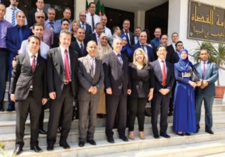
العاملون في السلك القضائي الجزائري

شارك نحو ٣٥ قاضياً ومدعياً عاماً جزائرياً في أول ورشة لتدريب المدربين ينظمها المكتب بالتعاون مع المدرسة العليا للقضاة، بشأن تعزيز التعاون الدولي في المسائل الجنائية ضد قضايا الإرهاب المعقدة العابرة للحدود. وقد تركزت المناقشات التقنية على التحديات الراهنة والممارسات السليمة المتعلقة بالتعاون الدولي في المسائل الجنائية، ولا سيما التحقيق في جرائم الإرهاب عبر الحدودي وملاحقة مرتكبيها قضائياً. علاوة على ذلك ركزت الورشة على تأسيس السلطات المركزية ودورها وعلى إنشاء فرق التحقيق المشترك وعملها، والتحديات بوجه التعاون فيما بين البلدان ذات النظم القانونية المختلفة، في منطقتي المغرب والساحل. تمول المشروع اليابان.