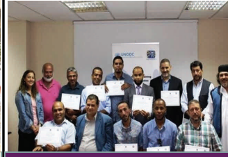
مكافحو الفيروس مع شهاداتهم

عقد المكتب بالتعاون مع مينة ورشة عمل وجولة دراسية إلى لبنان لأربعة عشر مهنيًا ليبيا في مجال الصحة العامة في تموز/يوليو وذلك لبناء القدرات الوطنية على الوقاية من هذا الفيروس وعلاج ورعاية المصابين به. ركز التدريب على تقديم خدمات خفض الضرر الشاملة لمتعاطي المخدرات ونزلاء السجون من خلال التوعية المجتمعية وخدمات مراكز الاستقبال، وعلى صياغة وتقديم مقترحات مشاريع خفض الضرر للمأخين. وقد قامت الجولة الدراسية الى مواقع تنفيذ برامج خفض الضرر، بما فيها العلاج البديل لأثر الأفيون بتزويد المشاركين بالمعرفة المباشرة بطرق التنفيذ لتكرارها مستقبلاً في ليبيا. تمول المشروع ليبيا.