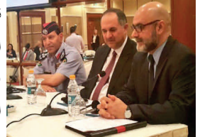
وزيرة العدل الأردنية تفتتح التدريب الإقليمي

قدم المكتب تدريبا إقليميا في عمّان للتصديّ لوقوع اللاجئين والنازحين من سوريا والعراق ضحايا للاتجار بالبشر، شارك فيه ضباط إنفاذ القانون والمسؤولين الحكوميين، والفاعلين في المجتمع المدني الذي يتعامل مع اللاجئين من مصر والعراق والأردن ولبنان وتركيا. وفي الوقت الذي ركّز فيه التدريب على كشف ومنع الاتجار بالبشر وتقديم المساعدة الوافية للضحايا، فقد وُفّر أيضا منبرا لتبادل المعلومات والتدريب المتعمّق على جريمة الاتجار بالبشر فضلا عن مسببات ضعف اللاجئين وآثاره، والتحديات أمام معالجة هذا الضعف إزاء الاتجار والسبل الممكنة للمضي قدما. تمول النمسا المشروع.