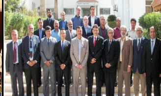
التدريب الأردني الباكستاني المشترك

في تموز/يوليو، عقدت منظمة الطيران المدني الدولي وبرنامج مراقبة الحاويات بالمكتب أول نشاط مشترك لهما في الأردن. وقد ضمت التدريبات على الشحن الجوي وأمن البريد مسؤولين من دولتي الأردن وباكستان الرائدتين في تنفيذ هذا البرنامج في مطاراتهما. فمهمة برنامج مراقبة الحاويات في المطارات هي تيسير التجارة المشروعة وتزويد سلطات الدولة المسؤولة عن مراقبة الحدود بما يلزم من مهارات للتعرف بدقة على الشحنات الجوية المطلوبة ووقفها، مع السماح بدخول الجزء الأكبر من البضائع إلى السوق التجارية. تمول المشروع الولايات المتحدة