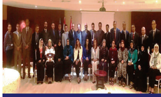
تدريب الوفد العراقي

يهدف تسهيل حوار السياسات فيما بين السلطات العراقية لمواجهة التحديات القانونية والعملية المتعلقة بالنساء المزمع انتماءهن لتنظيم داعش، عقد المكتب ورشة عمل في مصر لثمانية عشر من أعضاء الوفد العراقي في أيلول/سبتمبر. ضم الوفد عضواً في البرلمان وقضاة ومدعين عامين وضباط إنفاذ القانون. وخلال الورشة تبادل الوفد مع الخبراء الدوليين والإقليميين الآراء بشأن التحديات التي تفرضها ظاهرة تجنيد النساء بواسطة الجماعات الإرهابية مثل داعش من منظورات المجتمع وحقوق الإنسان والعدالة الجنائية والأمن، كما ناقشوا الممارسات السليمة لمكافحة هذه الظاهرة. تمول المشروع اليابان.