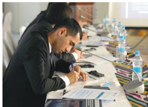
Учебный семинар по оценке риска и потребностей, Таджикистан, 2023