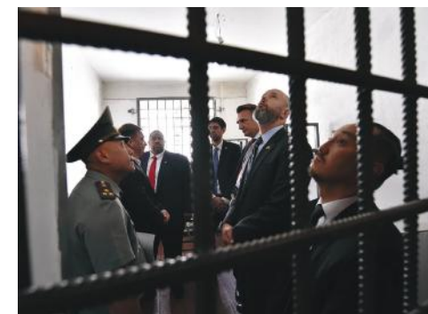
Визит Контртеррористического Бюро Государственного департамента США в исправительное учреждение, Кыргызстан, 2022