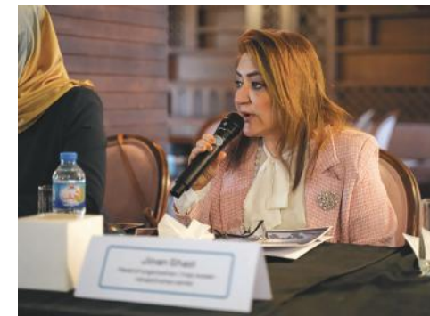
Встреча организаций гражданского общества, Ирак, 2022