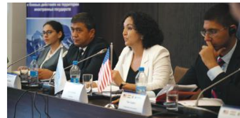
Заседание Координационного совета по реализации проекта, Таджикистан, 2023

Академия взяла на себя обязательство обеспечить дальнейшее обучение сотрудников пенитенциарных учреждений и служб пробации Кыргызстана, продемонстрировав свою приверженность созданию регионального центра знаний по предупреждению насильственного экстремизма в тюрьмах, содействию долгосрочному сотрудничеству во всем регионе и наращиванию кадрового потенциала. Участие Академии сыграло решающую роль в закладывании основы для устойчивых результатов программы. Страны-участницы договорились продолжать сотрудничество.