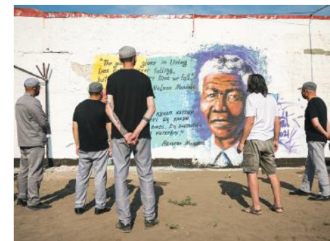
Внедрение правил Нельсона Манделы, Казахстан